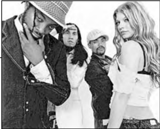
The Black Eyed Peas